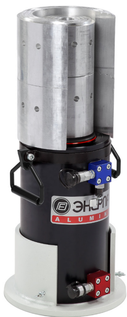
KN110-2 + ДТА110Г400