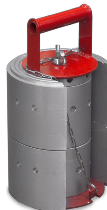
KN110-2 + ПНН110-2 (приспособление для переноски насадок)