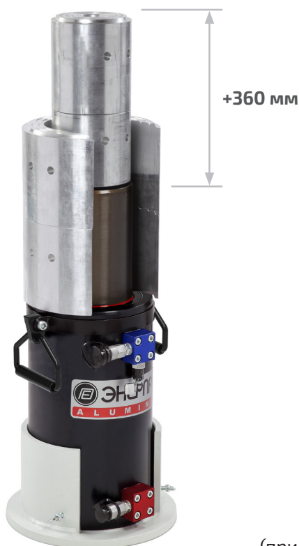
KN110-2 + ДТА110Г400